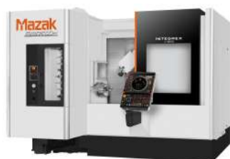
旋盤・複合旋盤加工機