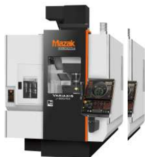
マシニング・5軸加工機