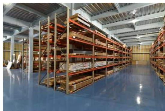
各種材料を多く取り揃え短納期に対応致します。